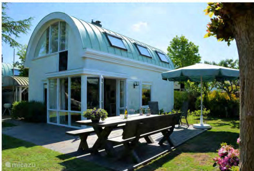
Walhalla aan zee.

Op vakantie gaan brengt vaak een bepaalde mate van behelpen met zich mee. Je kunt immers niet alle gemakken van huis meenemen. Maar dat hoeft niet, je kunt alle benodigdheden ook op de plaats van bestemming boeken. Je hoeft alleen maar wat kleding in te pakken en in de auto te stappen. Zo makkelijk kan het zijn.