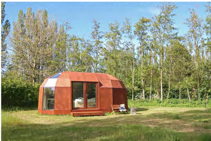
Zeeuwse Oase.