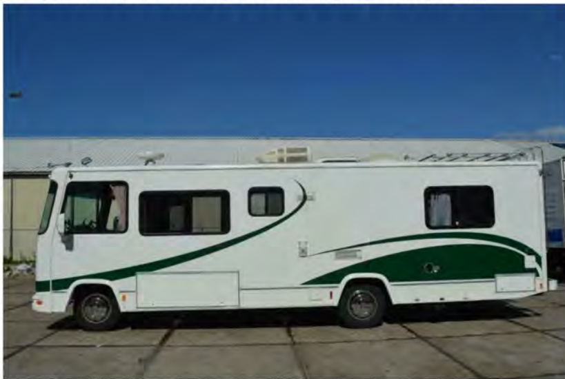
GMC Sun Clipper.

Geen zin om vast te zitten op één locatie, maar wil je ook niet inleveren op luxe? Dan blijft er maar een optie over: deze GMC Sun Clipper huren. Een grotere camper ga je niet vinden. Hij heeft een volledig gestoffeerd interieur inclusief fullsize bank, complete keuken en een bed in Amerikaans formaat. Comfort is dus gegarandeerd.