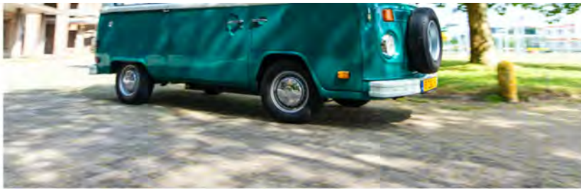
Elektrische Volkswagen T2.

We schreven eerder al dat campers enorm in populariteit stijgen in Nederland. Daar kun jij van profiteren zonder dat je er een hoeft te kopen. We vonden deze geweldige klassieker: de Volkswagen T2 . Hij heeft alleen iets bijzonders, want de verbrandingsmotor mist.