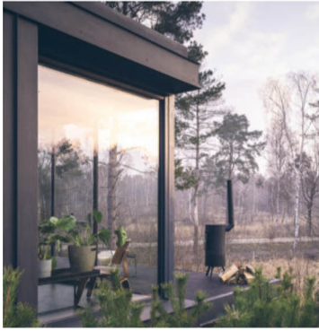
EINDELIJK EEN LUXE HIDEOUT IN DE NEDERLANDSE NATUUR: DE CUBER OUTDOOR SUITES