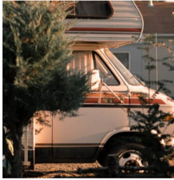
VANLIFE BIJ POP-UP CAMPING DE CAMPHANEN